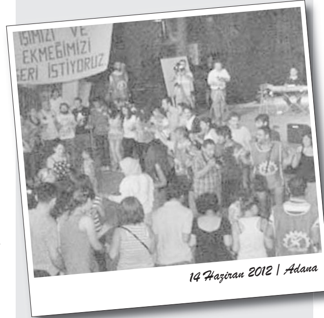
14 Haziran 2012 | Adana

Enerji-Sen üyesi TEDAŞ işçileri 14 Haziran akşamı Doğal Park içindeki Amfi Tiyatro’da dayanışma şenliği gerçekleştirdi.